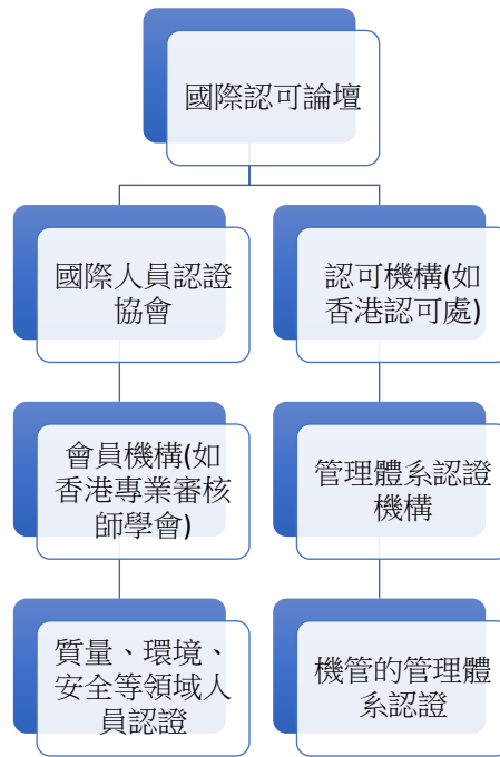
國際間人員及管理體系認證機構架構圖